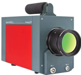
ImageIR® von InfraTec

Riesige Muldenkipper, wie der Komatsu 960E-1K, können mehr als 300 Tonnen abgebautes Gestein transportieren. Wenn sie sich dabei für mehrere Stunden auf steinigem Böden fortbewegen, ist die Belastung der Reifen enorm. Wie hoch genau, das ermittelt Bridgestone in Dauer- und Belastungstests in seinem Werk in Hofu im Südwesten Japans. Im Rahmen dieser Checks werden die unterschiedlichen Schichten des Reifens thermografisch untersucht. Zahlreiche Bohrlöcher in der Reifenkarkasse ermöglichen die Inspektion am Reifeninneren. Der Fokus bei den Außenprüfungen liegt hingegen besonders auf den peripheren Strukturen der Reifen.