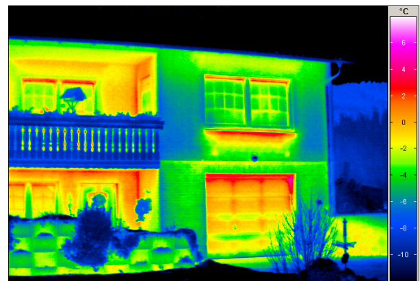
Wärmeverlust unterhalb vom Fenster und am Garagentor erkennbar

Generell positiv bewertet Olaf Hauck die Beratung durch InfraTec während und auch nach dem Kaufprozess sowie die zweitägige Einführungsveranstaltung, die ihm und seinen Kollegen eine schnelle Einarbeitung in die Bedienung der Wärmebildkamera und die technologischen Grundlagen der Infrarot-Thermografie ermöglicht hat.