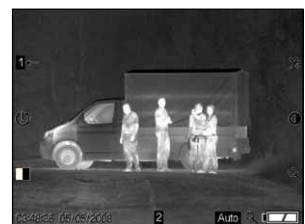
Identifikation von Personen