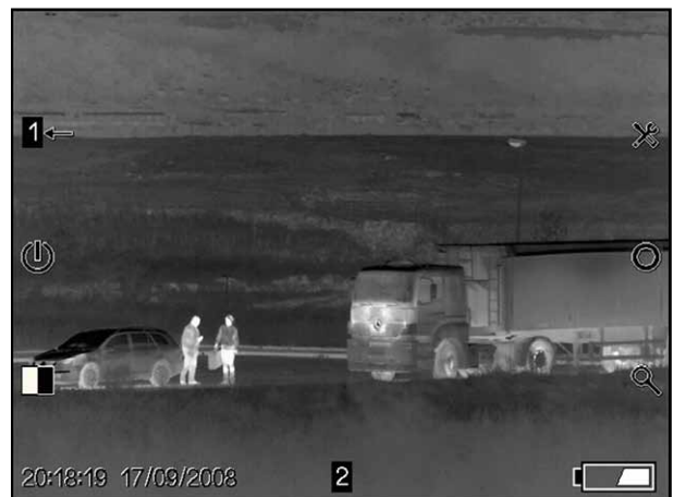
Überwachung und Aufklärung